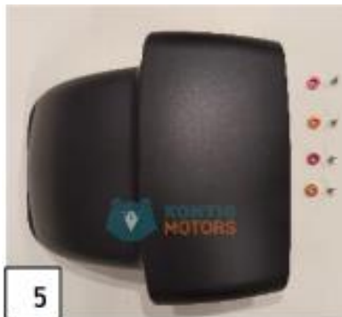
5 Etulokasuoja. (kuva 5).